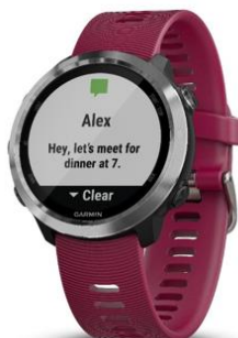
Forerunner® 645 Music Cerise

Vsebina kompleta: Forerunner 645 Music, polnilni kabel 1,15 A, dokumentacija