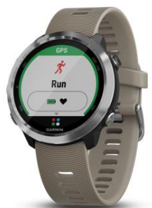
Forerunner® 645 Sandstone

Vsebina kompleta: Forerunner 645, polnilni kabel 1,15 A, dokumentacija