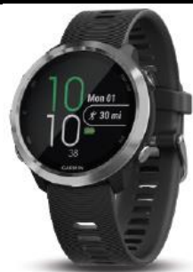
Forerunner® 645 Black