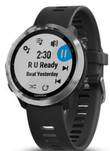
Forerunner® 645 Music Black

Vsebina kompleta: Forerunner 645, polnilni kabel 1,15 A, dokumentacija